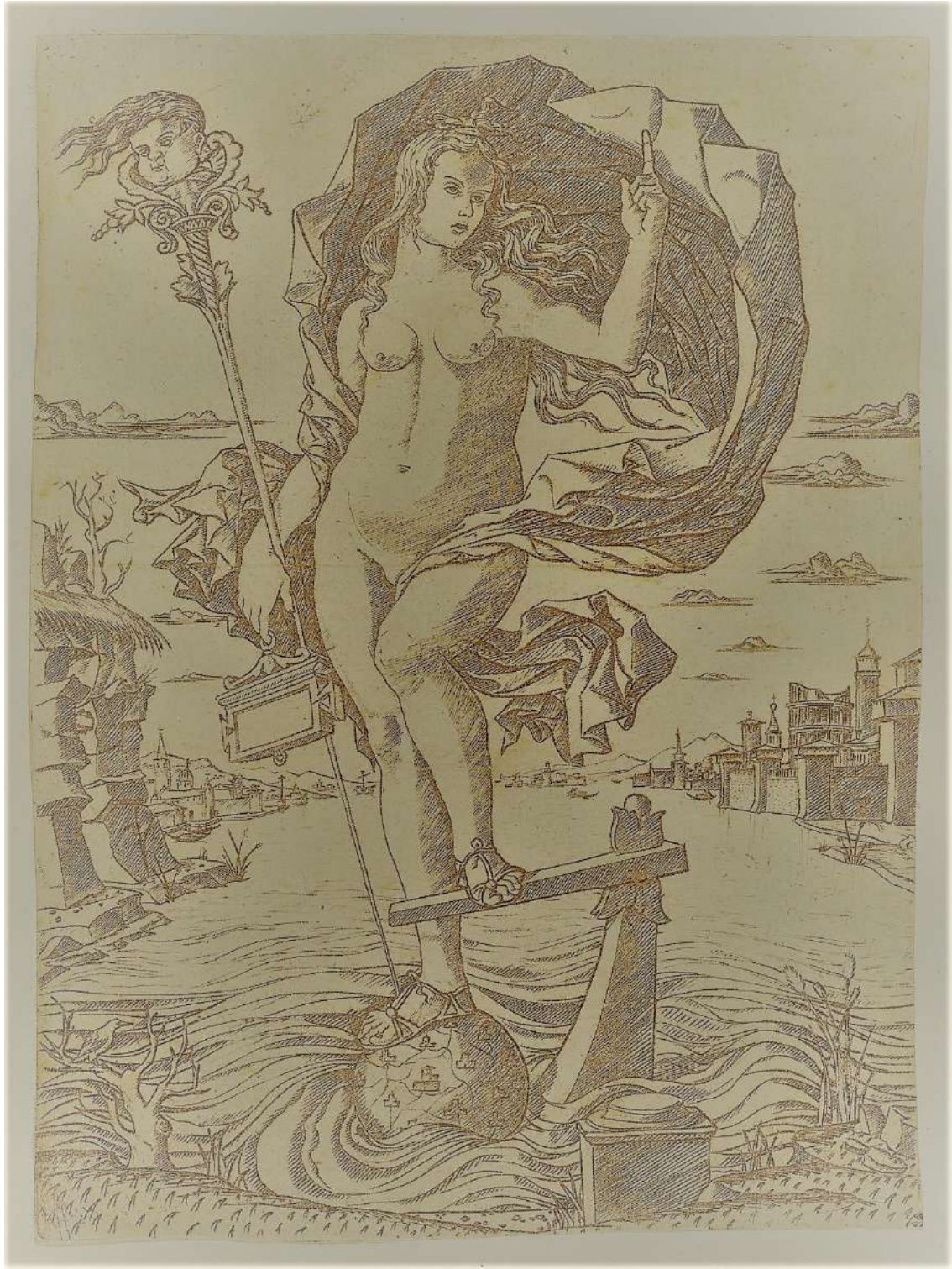
Título:Una figura femenina desnuda que representa la fortuna Artista: Nicoletto da Modena (italiano, Módena, activo ca. 1500– ca. 1520)